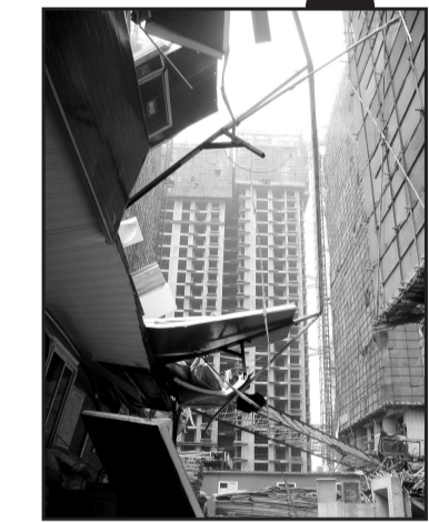
事故现场一片狼藉。

早上8点多,他正在院子里洗车,突然听到后面工地有人喊,一抬头,一座塔吊正慢慢砸向他们的大楼,几秒钟后,传出一声巨响,接着是滚滚沙尘。