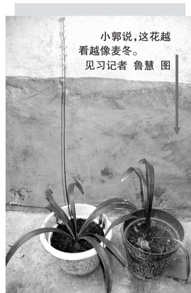
小郭说,这花越看越像麦冬。

“我只想老板太有才了。即使被人发现被骗也已经几个月了。”小郭对于驱蚊香草的事情表示很无奈,称有种被耍的感觉,并提醒市民,不要在路边摊上买奇特的东西,容易上当受骗。 见习记者 鲁慧