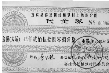
村民手中的代金券