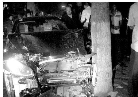
红旗车终于动不了了。视频截图

9月7日晚,王先生说:桐柏路与淮河路交叉口,一辆黑色轿车撞了一辆富康后跑了。晚报首席记者 徐富盈 文/图