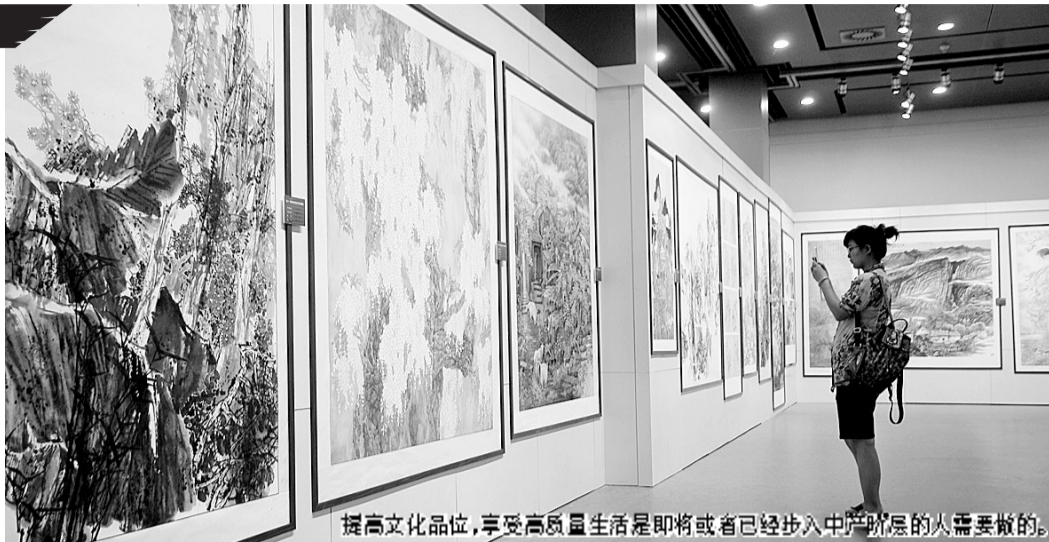
提高文化品位,享受高质量生活是即将或者已经步入中产阶层的人需要做的。