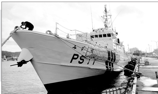
就是这艘日本巡逻船撞击了中国渔船。(右图)