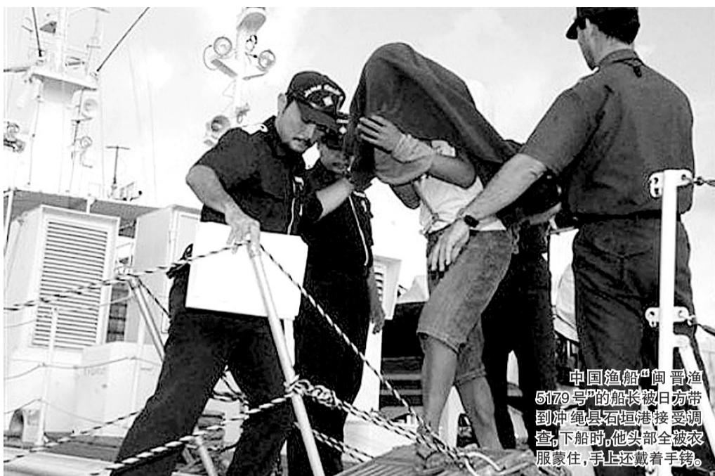
中国渔船“闽晋渔5179号”的船长被日方带到冲绳县石垣港接受调查,下船时,他头部全被衣服蒙住,手上还戴着手铐。