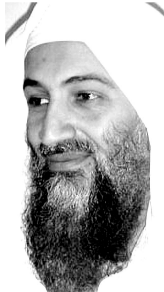
9·11恐怖袭击的主要策划者哈立德·谢赫·穆罕默德前后面貌变化,右图为拉丹。