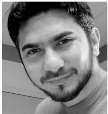
纽约时报广场未遂汽车炸弹袭击事件袭击者费萨尔·沙赫扎德。