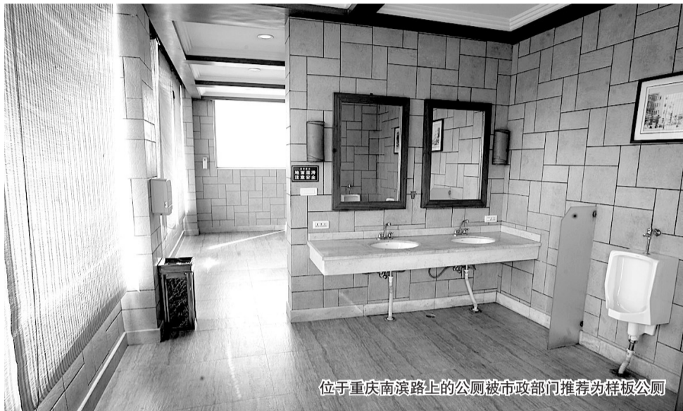
位于重庆南滨路上的公厕被市政部门推荐为样板公厕

该标准中各种限定条件多达八大项62条，其中最受关注的是这样一条：所有被评为星级的公厕都要全天开放，且不收费。只要收费了，就不能评星级。