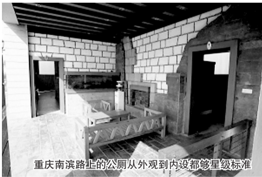
重庆南滨路上的公厕从外观到内设都够星级标准