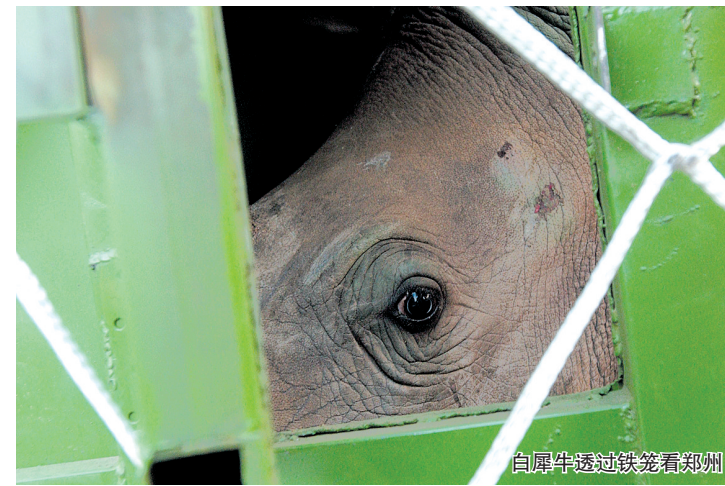
白犀牛透过铁笼看郑州