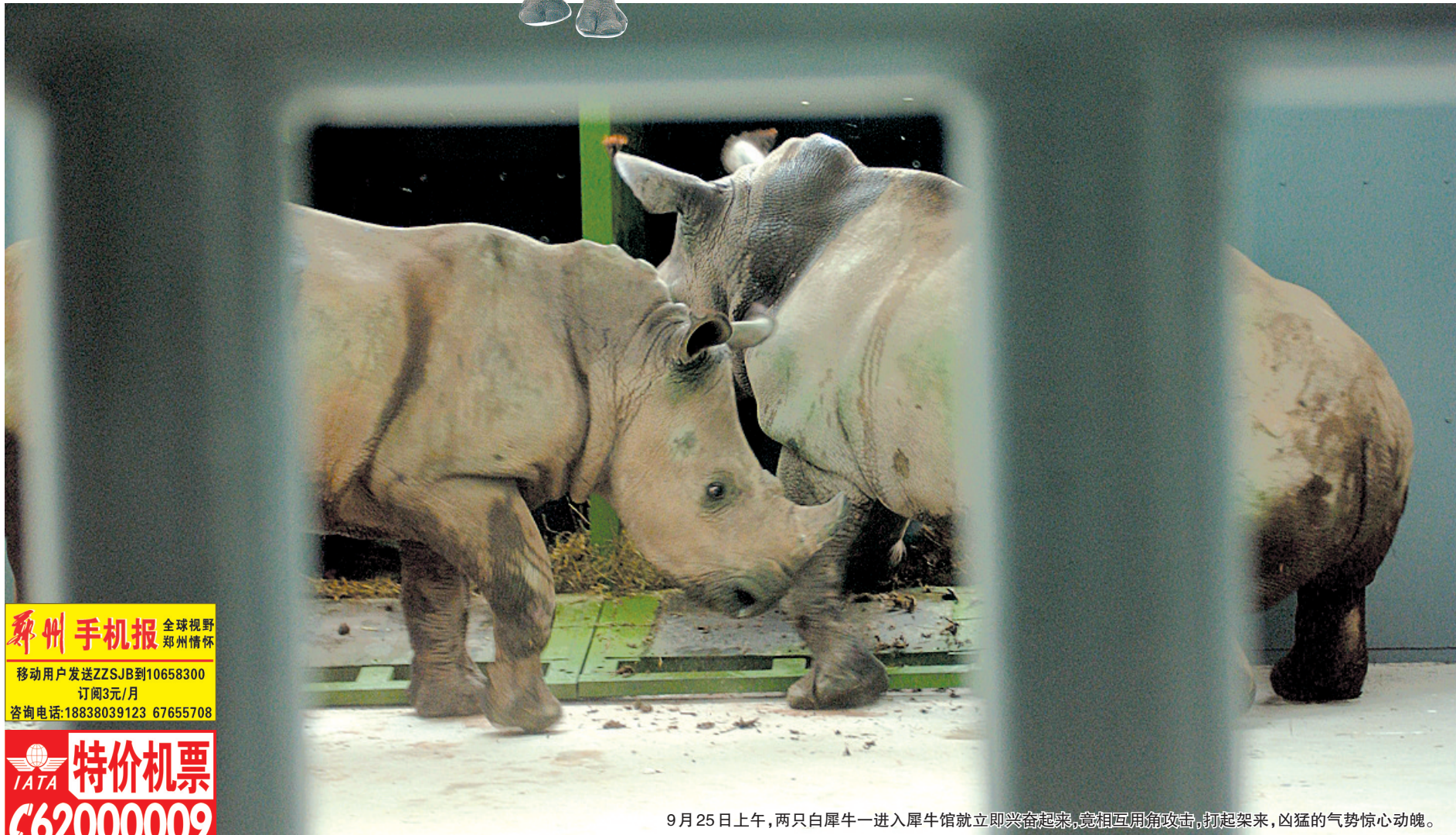
9月25日上午,两只白犀牛一进入犀牛馆就立即兴奋起来,竟相互用角攻击,打起架来,凶猛的气势惊心动魄。