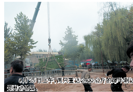
9月25日上午,两只重达2400公斤的犀牛到达郑州动物园。