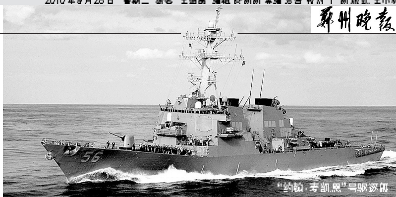
“约翰·麦凯恩”号驱逐舰