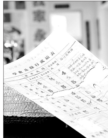
1963年的小学“学业及操行成绩表”中间一部分被老鼠咬烂了。