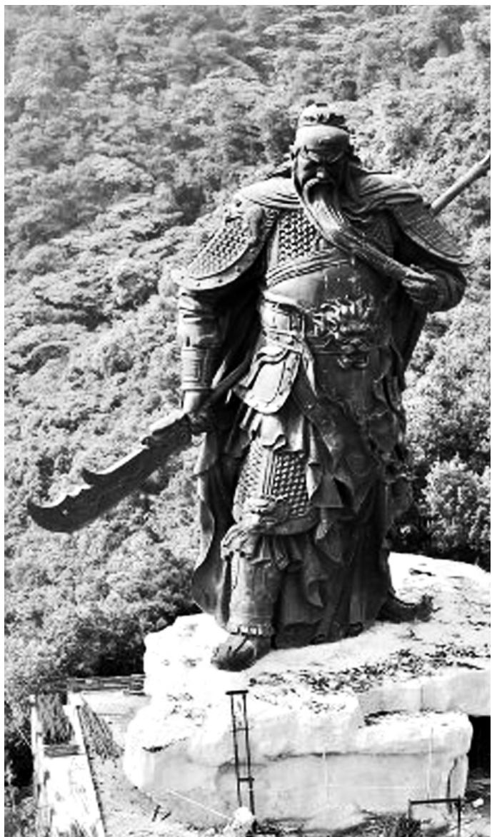
记者航拍到的关公像

2004年，肇庆市林业局通过招商引资引进深圳一家园艺公司承包千禧广场及周边约3500亩林地，建设将军山旅游风景区。承包后将将军山风景区违章建设了野生动物园、巨型关公像等建筑。关公像从2004年开始组织设计、施工，到2009年下半年基本完成主体结构 and 装修工程。