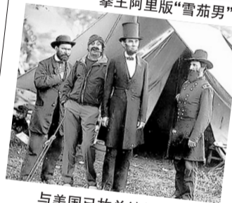
与美国已故总统林肯在一起