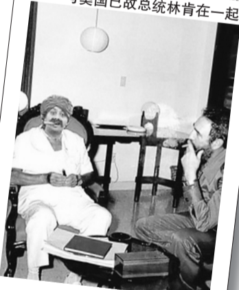
跟卡斯特罗一起抽雪茄