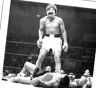
拳王阿里版“雪茄男”