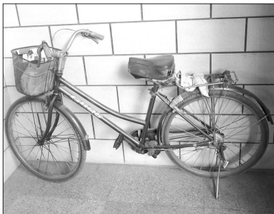
这辆自行车再也不能陪伴它的主人了。