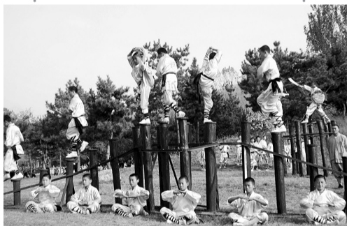
▲少林迎宾式之少林绝技表演

一部《少林寺》电影，让无数人记住了少林牧羊鞭。在迎宾队伍上，40人集体少林牧羊鞭表演，声震云霄，令人振奋。