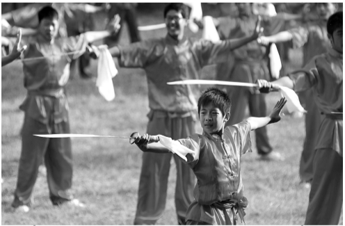
▲少林迎宾式之器械表演