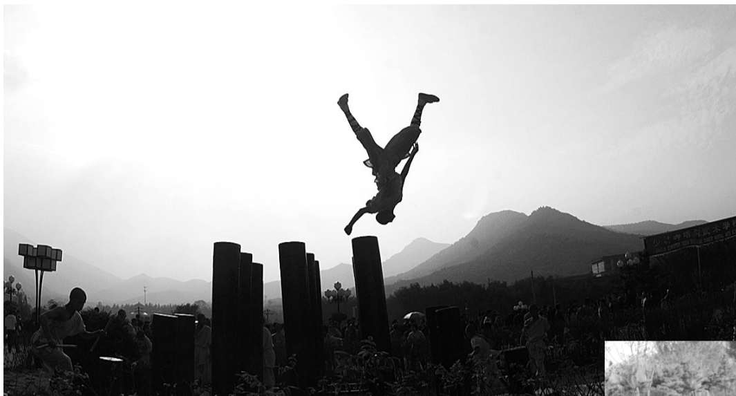
◀少林七十二绝技之梅花桩

当然,少林寺也有着“动静皆宜”的一面。瞧,这厢的琴棋书画区,老和尚正在书写《般若波罗密多心经》,而小和尚们正在用古筝弹奏《笑傲江湖》,颇让嘉宾们心里微微一颤。