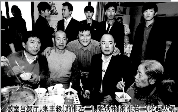
教室当餐厅,张丰毅(前排左二)张铁林(前排右二)吃起火锅