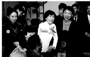
黄渤回学校,表现很“邻家”。

明星也是人,是人就应该尊师重道。2001年,季羨林先生给北京电影学院题校训“尊师重道,薪火相传”也正是这个道理。或许正是这样,才有了电影学院的今天。