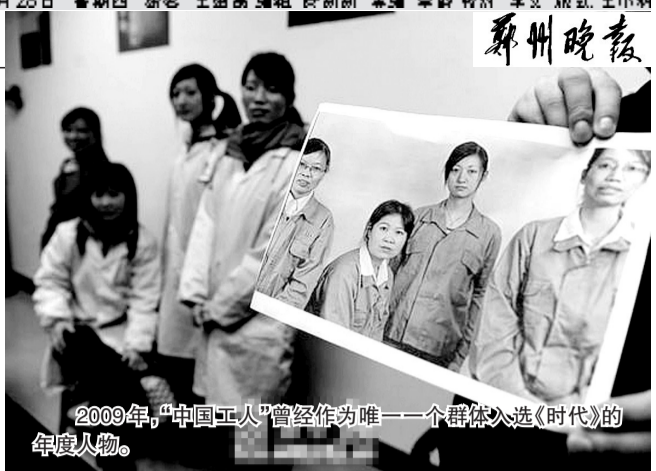
2009年，“中国工人”曾经作为唯一群体入选《时代》的年度人物。

2009年，“中国工人”曾经作为唯一群体入选《时代》的年度人物。当时《时代》评价说，中国经济带领世界走向经济复苏，这些功劳首先要归功于中国千千万万勤劳坚韧的普通工人。 据《环球时报》