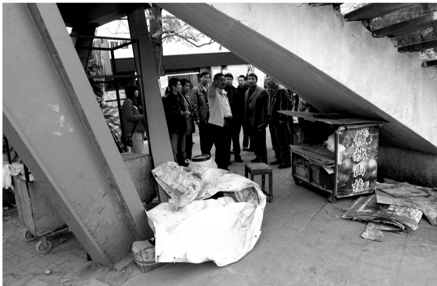
昨日,太康路与北二七路交叉东北角的过街天桥下堆积着各种杂物。综合执法组要求责任部门立即整改。

由市城市管理局牵头,市公安局、市规划局、市环保局、市爱卫办、金水区政府、二七区政府和管城区政府配合行动。