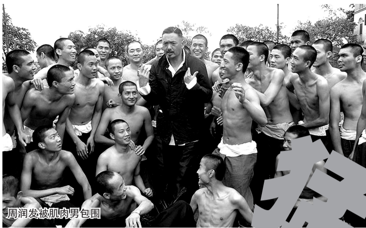
周润发被肌肉男包围