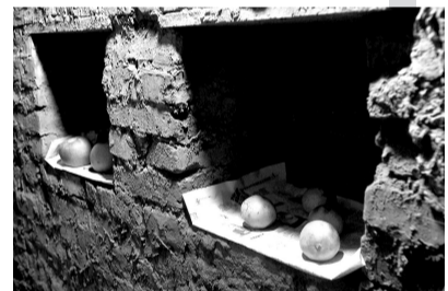
“地下居室”墙上还掏了摆放物品的壁橱。