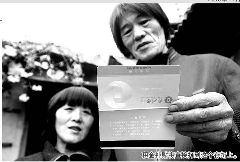
租金补贴将直接打到这个存折上。