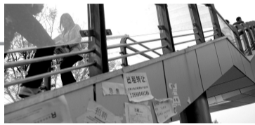
东风路文化路天桥引桥外贴满小广告。

要求可能有点过高，但却表现出市民对城市建设的强烈参与意识和希望交通设施更加人性化的殷殷之心。