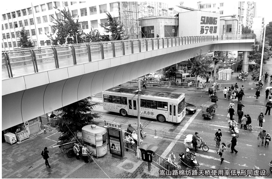
嵩山路棉纺路天桥使用率低，形同虚设。

所以，只有等到东南角的河医商圈竣工之后，这里的天桥才能“充”成环形，情况估计会有改观。