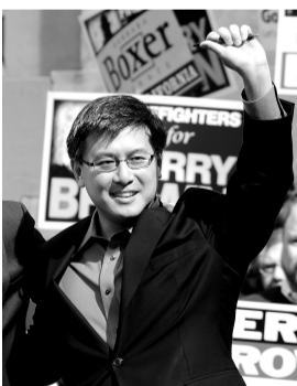
加州华裔主审计长江俊辉

11月2日举行的美国中期选举,加州华裔现任民选官员参与国会、州和市一级连任选举,全部顺利通过。