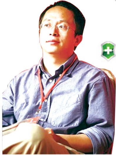
奇虎360 董事长 周鸿祎

在360与腾讯的这场大战愈演愈烈之时,有不少人都幻想一位灰发长辈把周鸿祎与马化腾叫到一起,慢悠悠地点燃一根烟说:“竞争不是乱搞。你们一个管10亿注册号、一个管3亿,乱弹窗的事儿已经搞大了,再打下去恐怕民众会遭殃。我看,差不多就收手吧!”