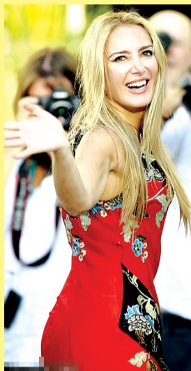
帕特丽齐亚·达达里奥

74岁的贝卢斯科尼10月29日回应称,自己“爱生活、爱女人”,不会为个人“休闲”行为致歉。