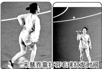
宋慧乔靠打羽毛球打发时间