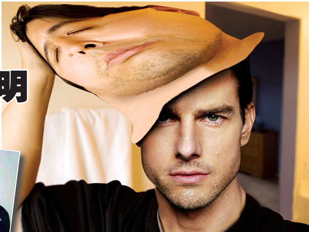
汤姆·克鲁斯在《碟中谍》中展现的高超易容术