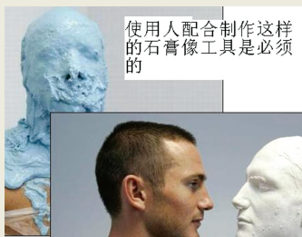
使用人配合制作这样的石膏像工具是必须的

AB两步也能用另一种方式代替,用高逼真的三位电脑雕像(由电脑雕刻师根据人1:1的照片做成),由化妆师雕刻形成塑像。但塑像逼真程度只能做到90%像。