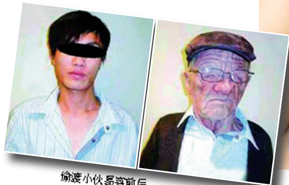
偷渡小伙易容前后

日前,一名20岁出头的中国香港小伙子,借助犹如好莱坞大片《碟中谍》中一般的高超易容术,变身一位满脸皱纹的白人老头,通过海关并登上一趟由香港飞往温哥华的航班。这名偷渡小伙已被加拿大海关边境署扣留,目前正在接受审查。