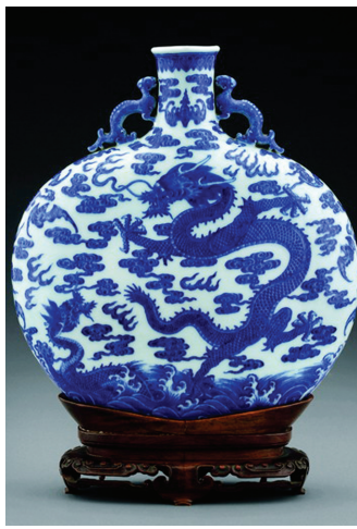
乾隆 青花苍龙教子双螭耳扁壶

近现代书画部分,突现“大牌、名牌、老牌”的名品风格,“张行藏画”现大师友情;“瀛海坝麓——李傅铎若藏溥心畲旅日逸品”将有数十幅珍藏已久的溥心畲作品首次亮相;“旧时明月——一个文人的翰墨因缘”汇集了香港学人董桥精致玲珑的收藏;“诗画辞章”专场将呈上范曾四十件盛年佳作。此外,再推张大千重要泼彩名作亦是张大千自画像的重要代表——1969年张大千七十岁时为四夫人徐雯波女士所绘《至徐雯波七十自画像与黑虎》以及《至张佛千五亭山色图及书法合璧》(由泼彩兼泼墨山水《五亭山色图》和《行书风蝶七律》书法横幅两件作品构成)。李可染早年巨制《长征》、徐悲鸿《七喜图》、目前所知石鲁尺幅最大的作品《芝兰书画卷》(高四十分,长近九米)等重量级作品将一同亮相。