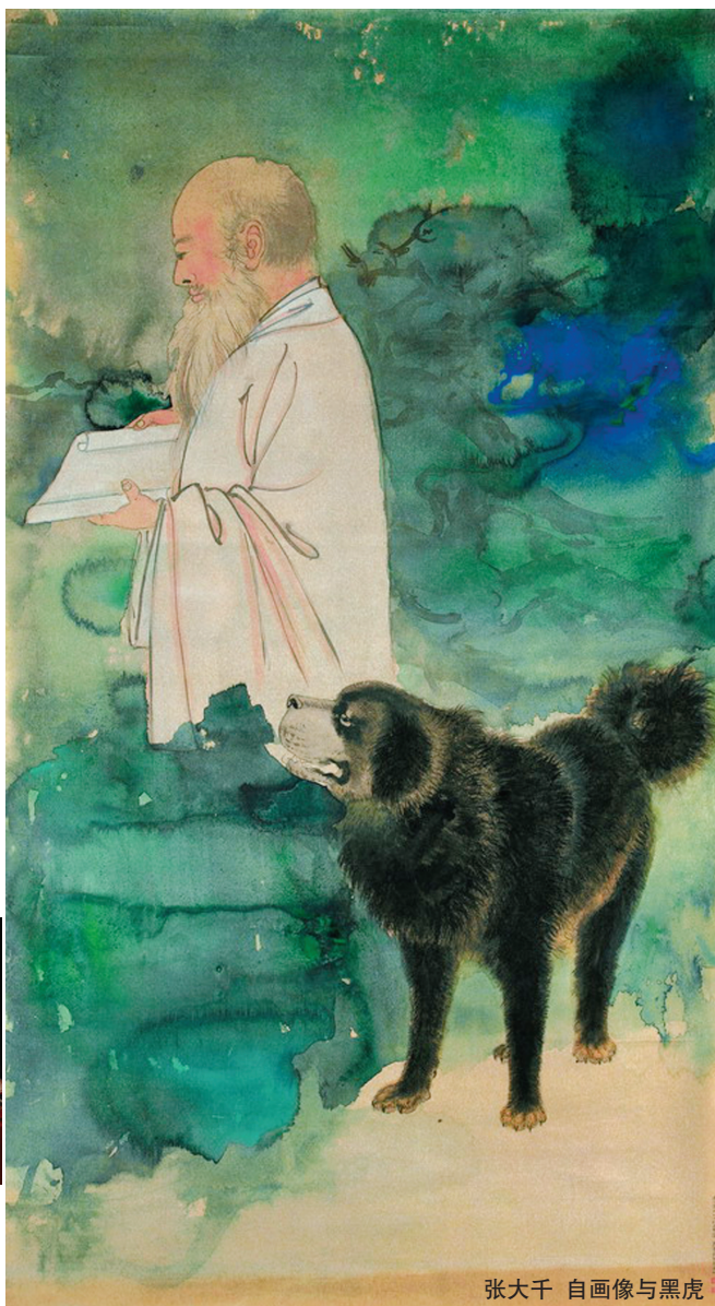
张大千 自画像与黑虎