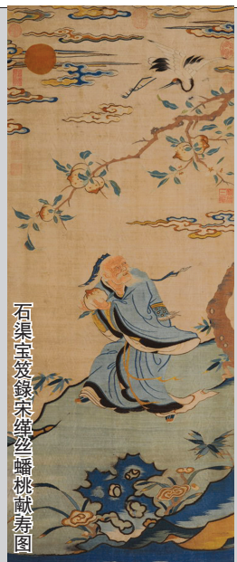
石渠宝笈录宋缂丝蟠桃献寿图

邮品钱币铜镜部分将推出六专场,涵盖十余个种类近5000件拍品,这也是中国嘉德此部分拍卖迄今为止这一门类数量、种类、场次最多的一次拍卖。其中,首次推出中国古钱币专场,将有数十枚包括“战国·燕‘安阳’方足布铜范”(中国最早的,或许也是世界上最早的和黄金等值的货币)、“战国·齐返邦长大刀”背“卜”齐国六字刀币(中国最早的纪念币)、战国-魏“燕环”圆钱、“西夏天盛元宝折十大钱”等传世孤品,精品现身。首次推出钱币系列,有“北宋·淳化元宝”等。机制币和贵金属币专场中,“民国二十五年(1936年)孙中山像中国、壹圆银质样币各一枚”、目前存世只有两套,极为名贵。“1916年袁世凯像中华帝国洪宪纪元飞龙金质样币(LM115A)”,“L. GIORGI”签字精铸版,极为少见,完全未使用。纸钞中,“中国银行袁世凯像绿色双狮共和纪念壹圆兑换券设计稿”,为吴筹中旧藏,为组合拼贴于卡纸上的设计样,仅见孤品。铜镜部分,大尺寸单龙镜“唐·云龙纹镜”以及镜面和镜背复合而成的“透雕虺龙纹复合镜”极其珍稀。邮票部分,无产阶级文化大革命的全面胜利万岁(“大一片红”)未发行邮票等新中国邮票史上撤销发行的十套邮票中的八种均值得关注。