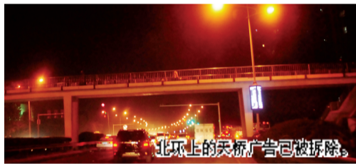
北环上的天桥广告已被拆除。