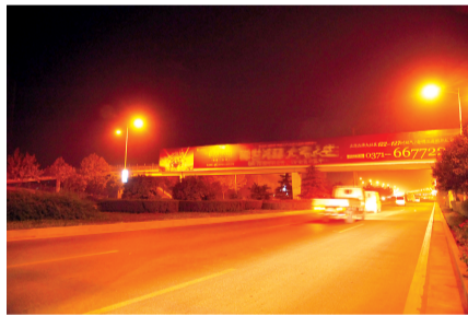
西三环和长江路口往南天桥上的广告牌也未被拆除。