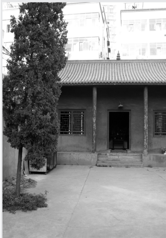
这就是押砦社区的关爷庙。

押砦为啥叫押砦?它有着什么样的历史渊源?现在的居民们又过着怎样的日子?今天让我们一起走进押砦社区,感受一下它的独特文化魅力。