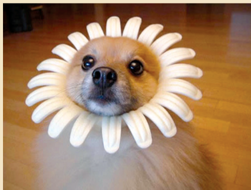
主人,主人,我要开花