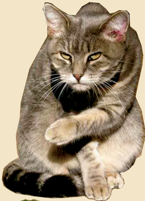
小样儿,想找事是不昂