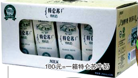
100元=一箱特仑苏牛奶