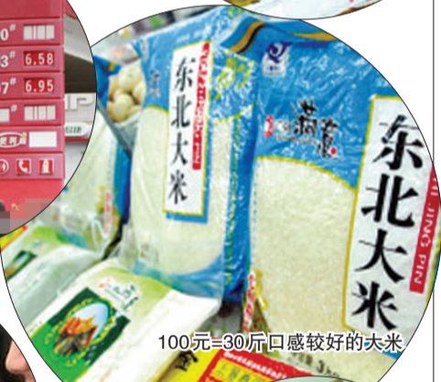
100元=30斤口感较好的大米