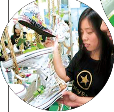
100元=一双打折的帆布鞋