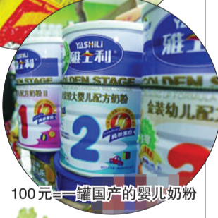
100元=一罐国产的婴儿奶粉

物价涨得这么高,怎么办?这两天,网友们对物价飞涨也展开了热烈讨论,许多网友在网上大晒生活成本,希望能供相关部门决策参考。