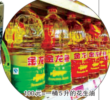
100元=一桶5升的花生油