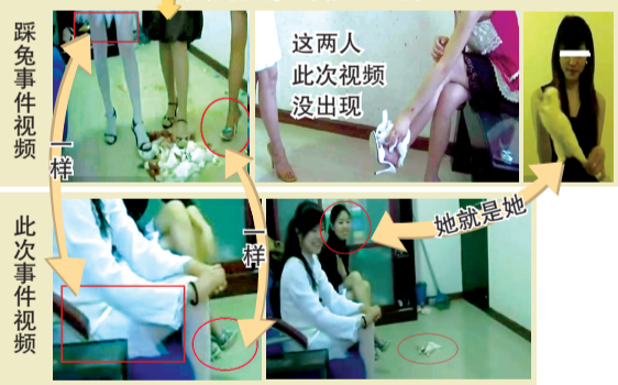
这两人此次视频没出现