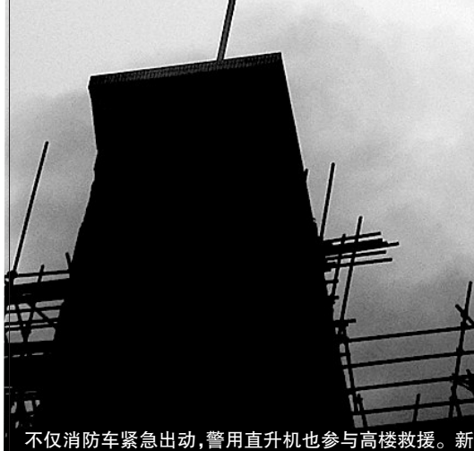
不仅消防车紧急出动,警用直升机也参与高楼救援。

在教师公寓对面大楼内工作的一位男性目击者表示,公寓外道路上堆放的材料着火引起脚手架燃烧,进而引发大楼失火。