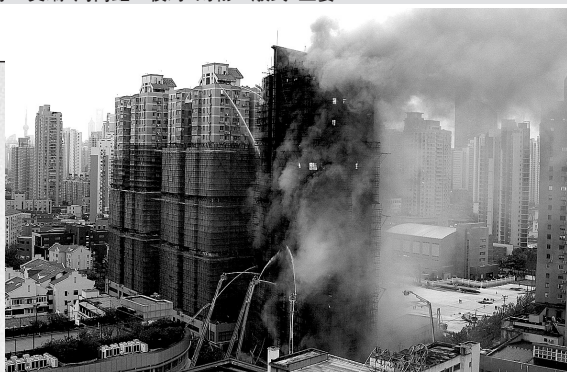
数辆消防车同时对着火大楼进行扑救。

12日,山西临汾市洪洞县城中心地段一高档小区内发生凶案,一对警察夫妇在家中遇害。两人育有两女一子,均在美国留学,知情人称,死者的宝马车停在车库,楼道有一摊血迹,男子脖子有勒痕。男死者生前曾开办过企业,在当地很有名气。据《新京报》