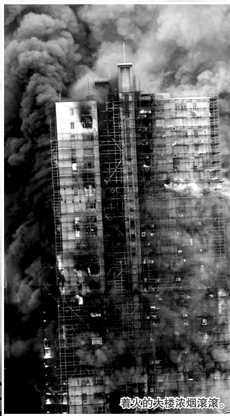
着火的大楼浓烟滚滚。