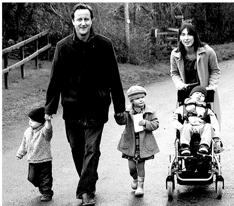
英国首相卡梅伦一家

具体实施方案尚待商议。例如,是编制一个“快乐指数”,还是编制多项指数综合反映幸福程度;是像“英国犯罪调查”那样每年公布4次,还是另外设定频率。 据新华社电