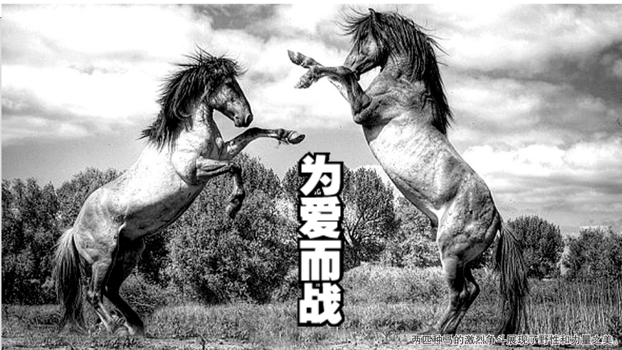
两匹种马的激烈争斗展现了野性和力量之美。

据国外媒体昨日报道,摄影师亨利·唐在荷兰一处自然保护区捕捉到两匹种马,因争夺地盘和交配权激烈争斗前腿互踢的火爆场面。