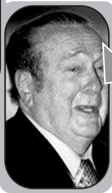
▶里奥兹(巴拉圭人,南美足联主席)