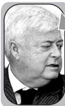
▲特谢拉(前国际足联主席阿维兰热的女婿、巴西足协主席)