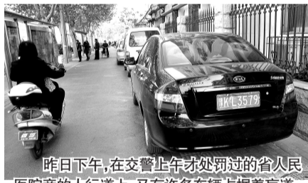
昨日下午,在交警上午才处罚过的省人民医院旁的人行道上,又有许多车辆占据着盲道。

对于辖区内居民楼院出现大量垃圾的问题,下午5时30分许,记者与南阳新村街道办事处城管办取得联系,工作人员表示已向小孟寨社区了解情况,垃圾最迟当晚清理完。