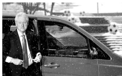
美国前总统克林顿

卡塔尔之所以成功申办2022年世界杯,它的王牌说穿了就是三个字:我有钱。卡塔尔计划用40亿美元兴建9个球场,另外再翻新3个球场。此外,卡塔尔还许诺,在世界杯结束后会将那些美轮美奂的球场整体挪送给那些足球运动落后的国家。卡塔尔方面还表示,所有球场都将使用新的制冷系统,届时球场温度将控制在27℃左右。