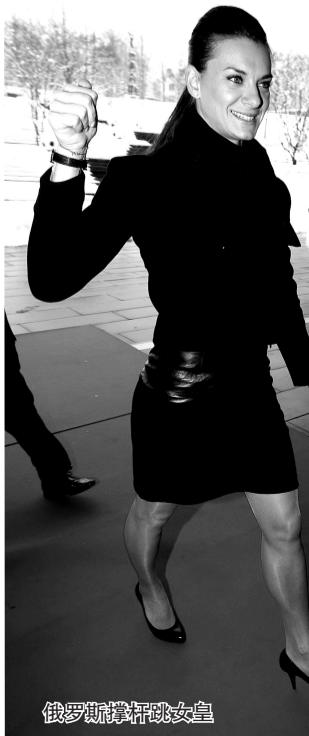
俄罗斯撑杆跳女皇