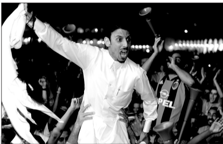
卡塔尔民众在老市场庆祝申办成功。