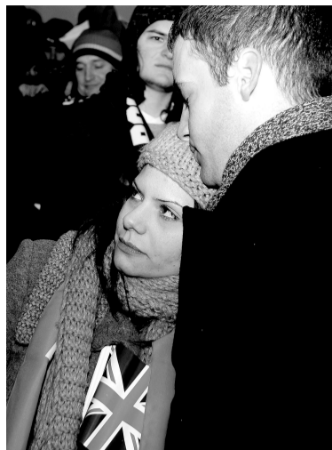
伤心的英格兰球迷