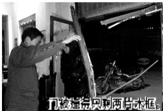
门被撞后只剩两片木框。

李先生说:西四环马寨经济开发区工业路与明晖路交叉口一饭店,半夜飞进来一个大轮胎,把老板娘砸伤了。