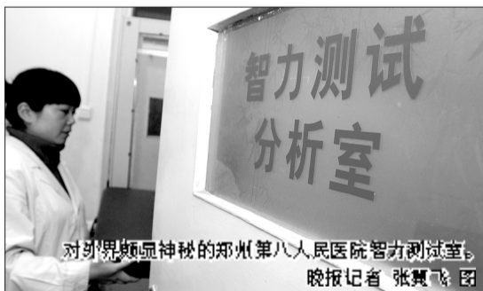
对世界显神秘的郑州第八人民医院智力测试室。

专家说,一些学习上确实有困难的学生,通过智力测试,可以找出学习困难的原因,是确属学生的智力问题,还是家长、老师的教育方法问题。“这些孩子可以做智力测试。”