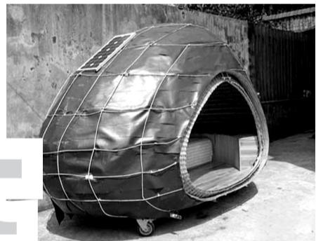
披上“外衣”,装上太阳能板