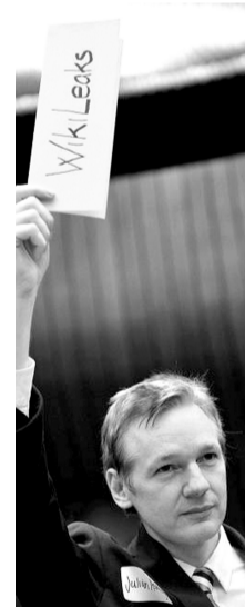
维基解密创办人阿桑奇