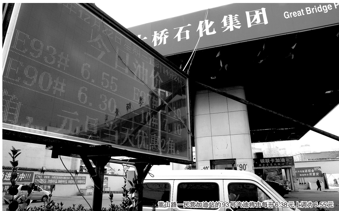
嵩山路一民营加油站的93号汽油将由每升6.38元上调为6.55元

昨日是我国今年第三次汽柴油涨价的第一天。不少车主说,这次汽柴油涨价让业内感到很意外,甚至有些莫名其妙。车主们对这次涨价提出了三点质疑:油价为何跟涨不跟跌?汽柴油涨价是不是给通胀火上浇油?油价上涨能否抑制油荒? 晚报记者 徐刚领/文