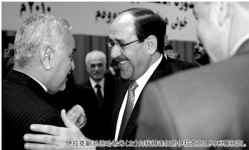
伊拉克副总统哈基米(左)向获得连任的伊拉克总理马利基祝贺。

今年3月7日议会选举中,前总理伊亚德·阿拉维领导的逊尼派阵营“伊拉克名单”以3票优势战胜马利基领导的什叶派阵营“法治国家联盟”,但两派所获议席数均未超过组阁所需的163席。两派就组阁存在分歧,迟迟未能组建新政府。 新华社供本报特稿