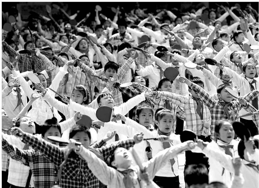
4月29日上午,金水区纬三路小学的同学做课间操时,人人手里拿着乒乓球拍,跳起了“乒乓球操”。市委明年要花大力气解决小学和幼儿园不足的问题。