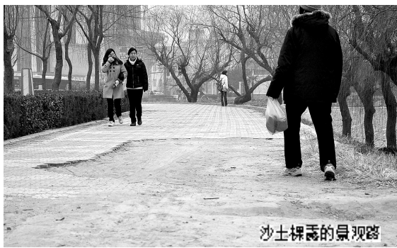
沙土裸露的景观路

附近省中医学院和曼哈顿广场等地的居民们表示:修地铁不会修到金水河里去,也不会破坏河堤。如果说广场里部分乱象,是因为即将拆迁,那河边的不文明现象,希望管理部门能尽快解决。