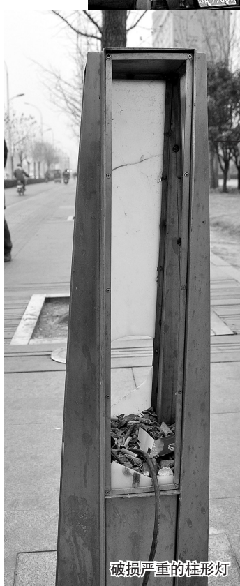
破损严重的柱形灯