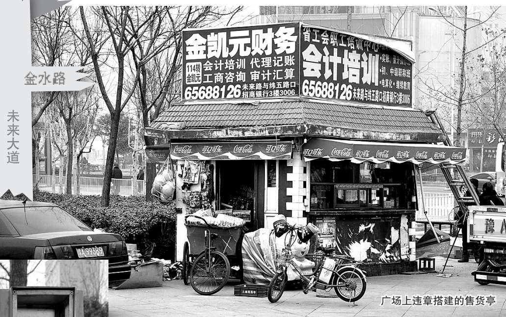
广场上违章搭建的售货亭