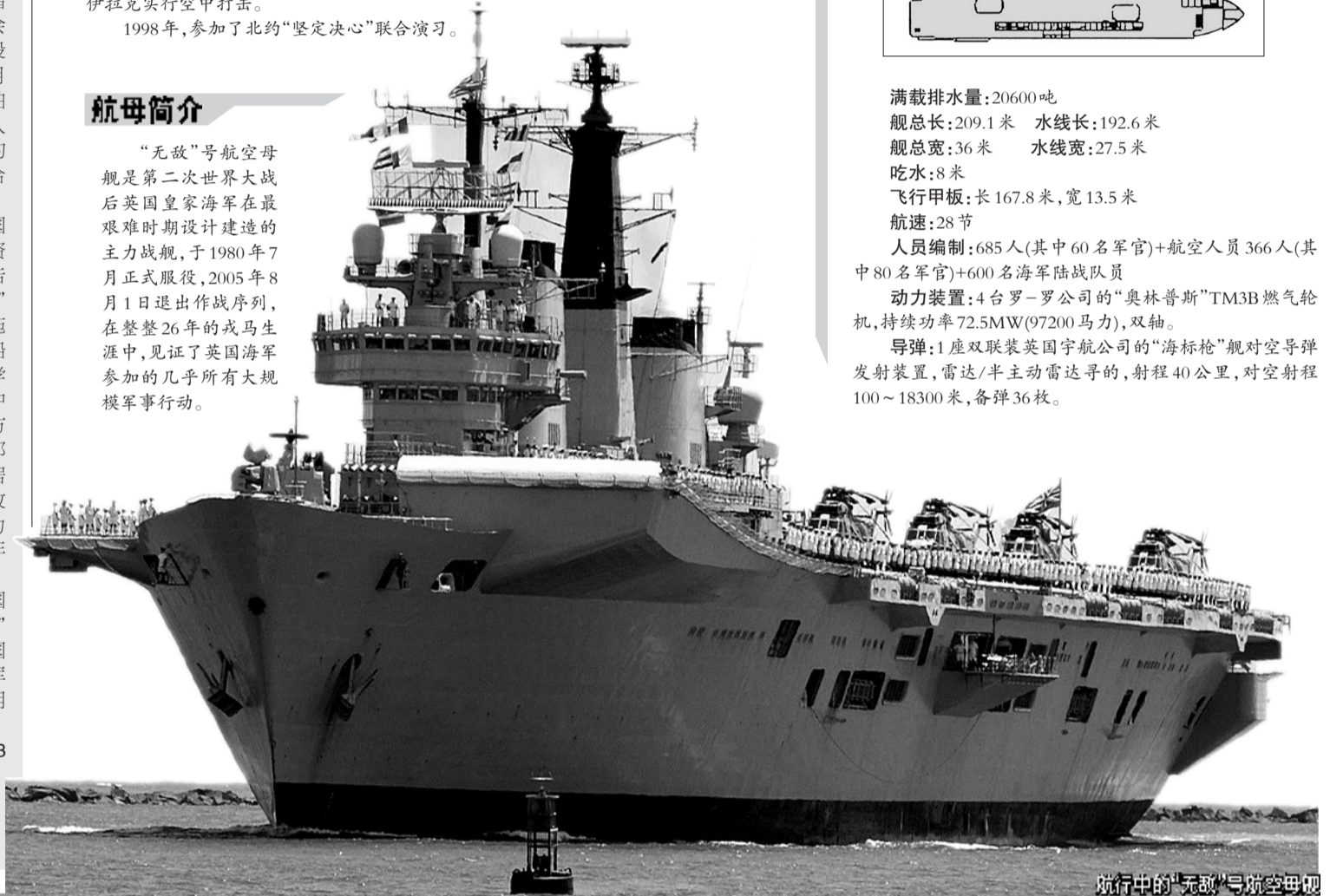
航行中的“无敌”号航空母舰

满载排水量:20600吨 舰总长:209.1米 水线长:192.6米 舰总宽:36米 水线宽:27.5米 吃水:8米 飞行甲板:长167.8米,宽13.5米 航速:28节 人员编制:685人(其中60名军官)+航空人员366人(其中80名军官)+600名海军陆战队队员 动力装置:4台罗-罗公司的“奥林巴斯”TM3B燃气轮机,持续功率72.5MW(97200马力),双轴。 导弹:1座双联装英国宇航公司的“海标枪”舰对空导弹发射装置,雷达/半主动雷达寻的,射程40公里,对空射程100~18300米,备弹36枚。