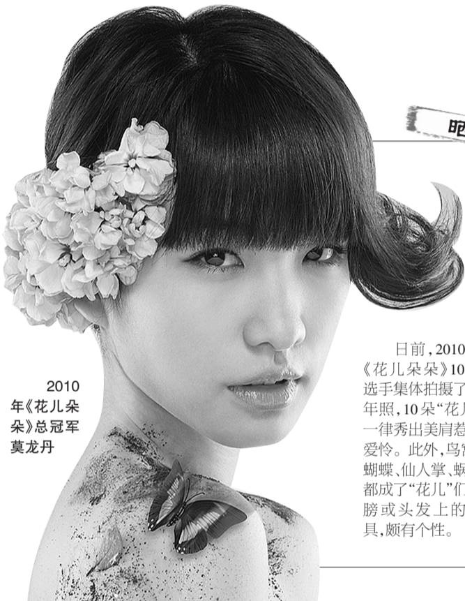
2010年《花儿朵朵》总冠军莫龙丹

表扬一下自己,元旦3天,天天画画,画纸越来越大,画案也越来越邪乎,已经从写字台换上大面板了,无知者无畏嘛!本来想歇会儿,却想起姥姥语录:“等着上那边儿再歇着吧,那边儿有的是工夫歇,想起都起不来!”多珍惜时间的姥姥啊,她确信人没有下辈子!